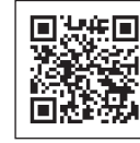
「奨学金の制度（給付型）」